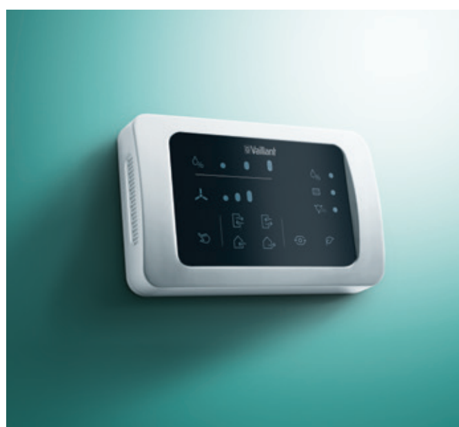
Wyposażenie dodatkowe: VAZ-CPC – panel kontrolny z czujnikiem CO 2

W trybie ekonomicznym wentylacja działa wyłącznie wtedy, gdy wilgotność powietrza jest zbyt wysoka – i w ten sposób oszczędza energię. Funkcja wentylacji „przewietrzenie” umożliwia automatyczne wyłączenie odzysku ciepła.