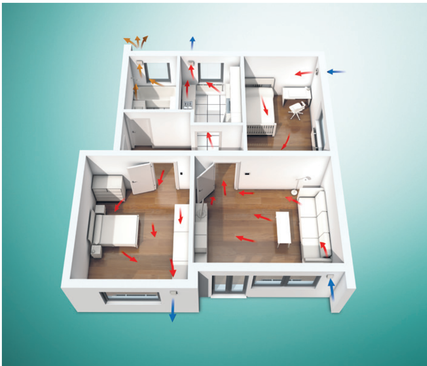
Przykład instalacji systemu recoVAIR VAR 60