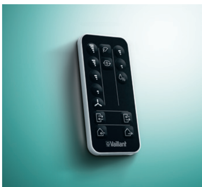
Wyposażenie dodatkowe: VAZ-RC – pilot do zdalnego sterowania

Urządzenia recoVAIR VAR 60 można dostosować do najróżniejszych potrzeb. W wybranych trybach pracy wydajność wentylacji można zoptymalizować według potrzeb, minimalizując zużycie energii: to komfort w połączeniu z klasą efektywności energetycznej A.