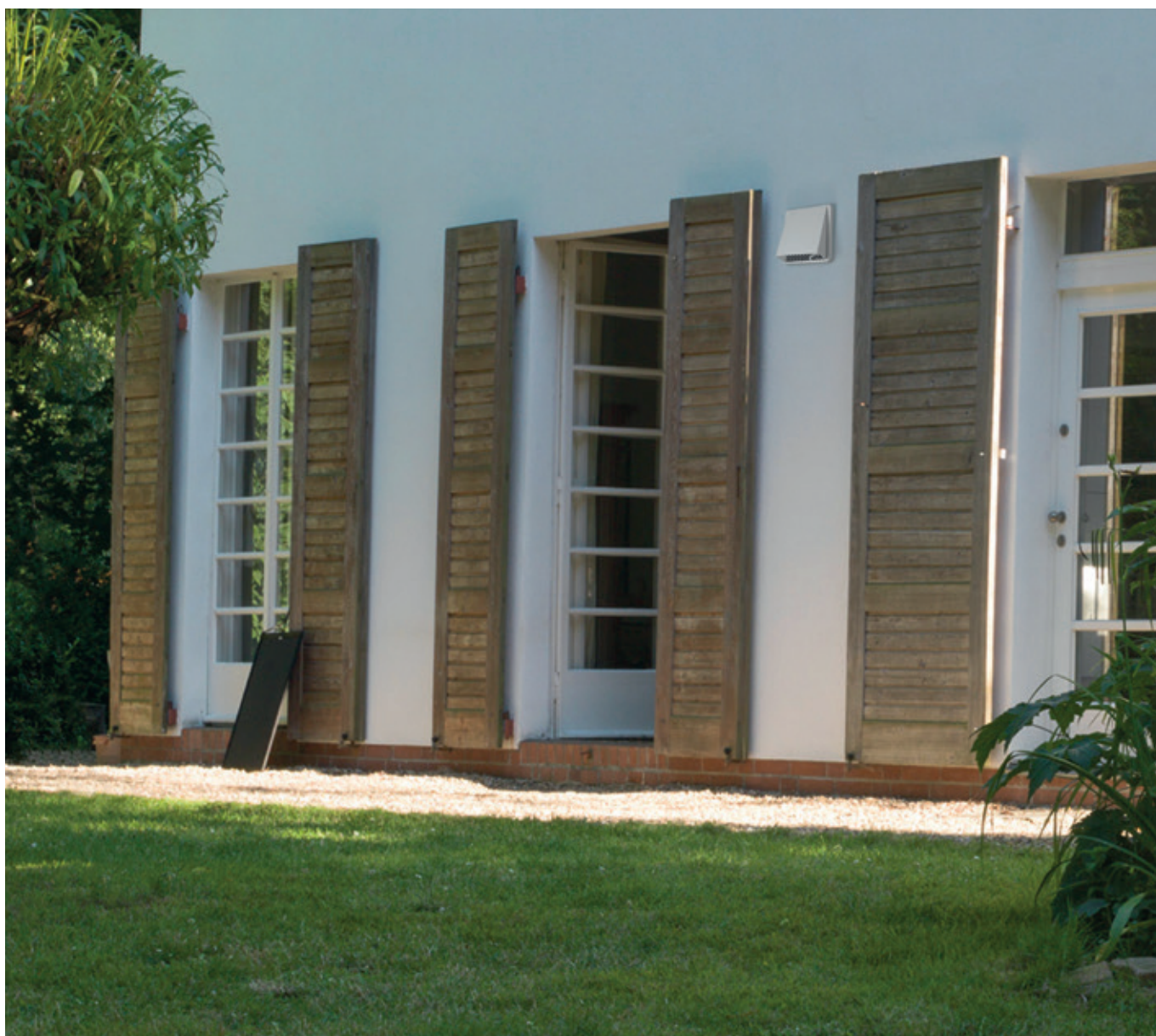
recoVAIR VAR 60: czerpnia/wyrzutnia zewnętrzna