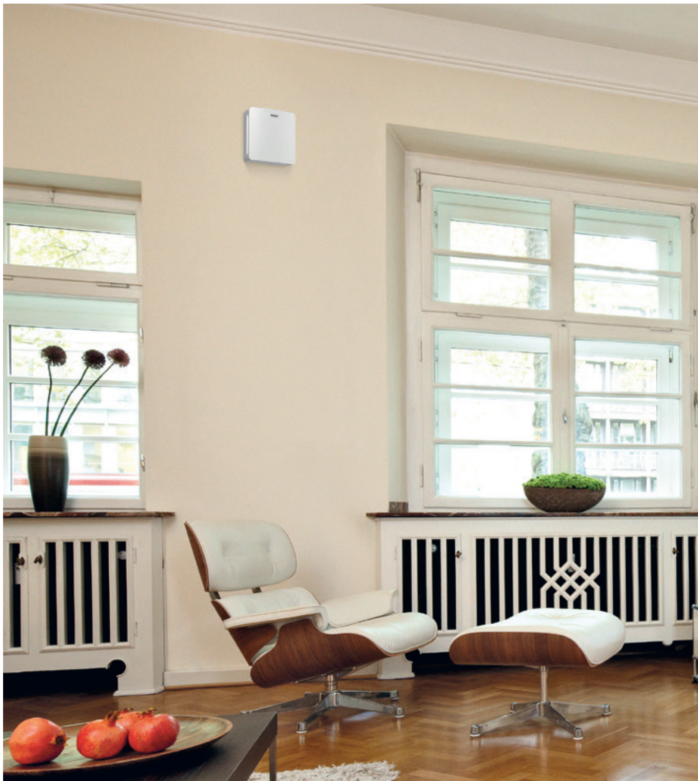
recoVAIR VAR 60: czerpnia/wyrzutnia zewnętrzna

System lokalnej wentylacji recoVAIR VAR 60 to rozwiązanie w korzystnej cenie: zajmuje niewiele miejsca w pojedynczym pomieszczeniu oraz pozwala zmodernizować dom jedno- czy dwurodzinny. Taka instalacja doskonale nadaje się również do wentylowania budynków wielorodzinnych albo pojedynczych mieszkań bądź pomieszczeń.